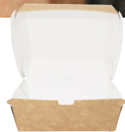
0310235 PORTA PANINO MAXI PAP ONLY PAPER dimensioni size 160x155h90 mm pz/conf pcs/pack 50 pz/cart pcs/box 300