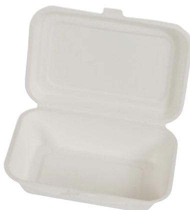
YDB030 CONTENITORE+COPERCHIO BIO-ECO dimensioni size 251x162 h50/63 mm capacità capacity 750 ml temp. max. PFAS-FREE 95° pz/conf pcs/pack 50 pz/cart pcs/box 500