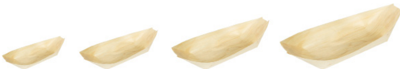
GW3015 BARCETTA PALMA dimensioni size 115x70 mm pz/conf pcs/pack 50 pz/cart pcs/box 1000