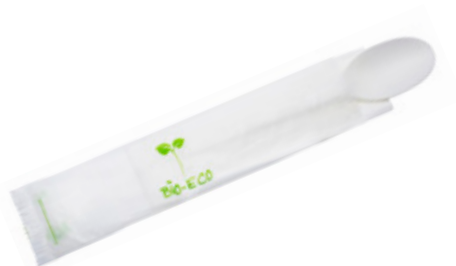
1VP213 CUCCHIAIO C-PLA 4,8 gr + TOVAGLIOLO SPOON + NAPKIN pz/cart pcs/box 500