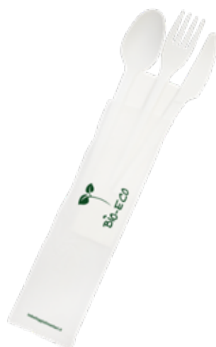
1VP379 TRIS + TOV. 2 VELI (forch/colt/cucch) 75-80° gr 3,5 TRIS+NAPKIN 2 LAYER (fork/knife/spoon) 75-80° gr 3,5 pz/cart pcs/box 500