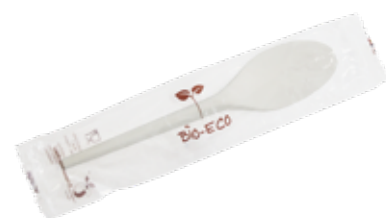
1VP314 CUCCHIAIO C-PLA 16,5 cm/4,8 gr IMBUSTATO SINGOLARMENTE (spoon) pz/cart pcs/box 500