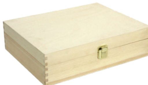
502354 CASSETTA CHIUSA 3 BOTTIGLIE PINO NATURALE dimensioni size 35x27 h9 cm pz/cart pcs/box 12