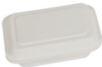
YDB001 CONTENITORE+COPERCHIO BIO-ECO dimensioni size 191x136 h44/59 mm capacità capacity 500 ml temp. max. PFAS-FREE 95° pz/conf pcs/pack 25 pz/cart pcs/box 500