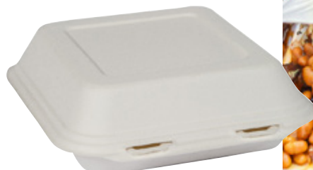
YDB026 CONTENITORE+COPERCHIO BIO-ECO dimensioni size 218x207 h40/64 mm capacità capacity 700 ml temp. max. PFAS-FREE 95° pz/conf pcs/pack 50 pz/cart pcs/box 250