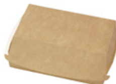
0310254 PORTA PANINO RETTANGOLARE ONLY PAPER dimensioni size 150x100h70 mm pz/conf pcs/pack 100 pz/cart pcs/box 600