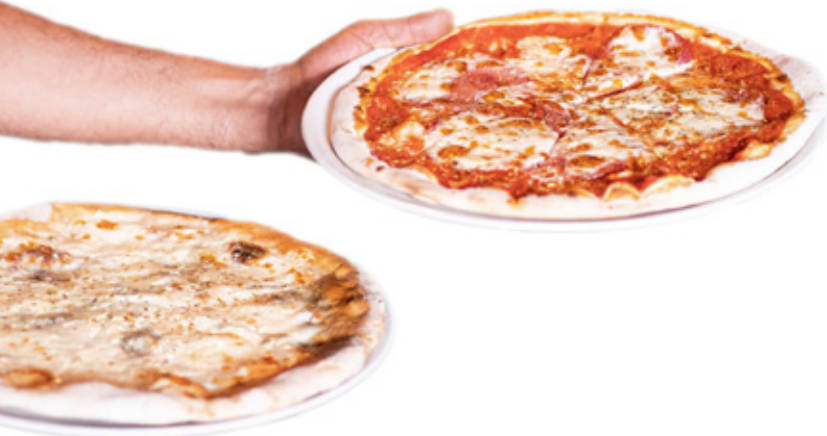
YDP033 PIATTO PIZZA BIO-ECO diametro diameter 33 cm pz/conf pcs/pack 25 pz/cart pcs/box 500