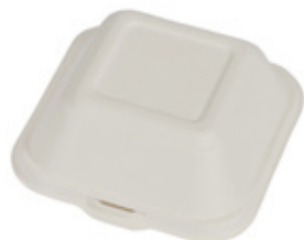
YDB024 CONTENITORE+COPERCHIO BIO-ECO dimensioni size 145x141 h47/75 mm capacità capacity 310 ml temp. max. PFAS-FREE 95° pz/conf pcs/pack 50 pz/cart pcs/box 500