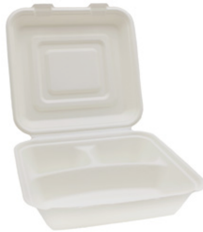
YDB032 CONTENITORE+COPERCHIO BIO-ECO TRISCOMPARTI dimensioni size 238x234 h55/76 mm capacità capacity 1000 ml temp. max. PFAS-FREE 95° pz/conf pcs/pack 50 pz/cart pcs/box 250