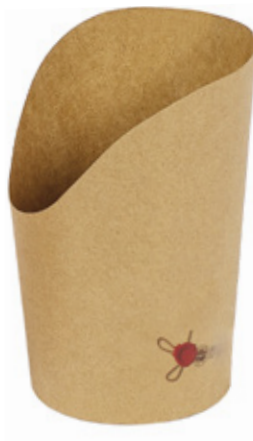
0310262 COPPA P/PATATINE AVANA GRANDE dimensioni size Ø70 h78/130 mm pz/conf pcs/pack 50 pz/cart pcs/box 1000