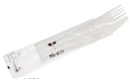
1VP316 BIS C-PLA 4 gr cad. + TOVAGLIOLO (forchetta/coltello/tovagliolo 2 veli) (fork/knife/napkin 2 layers) pz/conf pcs/pack 50 pz/cart pcs/box 250