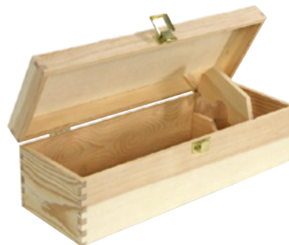
502351 CASSETTA PINO NAT. CHIUSA 1 CHAMPAGNE dimensioni size 38x13 h12 cm pz/cart pcs/box 20