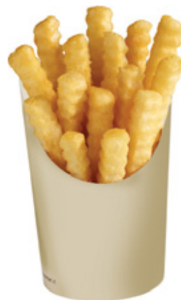
0310212 COPPA P/PATATINE GRANDE capacità capacity 24 oz dimensioni size Ø70 h78/130 mm pz/conf pcs/pack 50 pz/cart pcs/box 1000