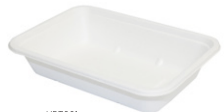
YDT001 VASCHETTA BIO-ECO dimensioni size 170x120 h40 mm capacità capacity 500 ml temp. max. PFAS-FREE 95° pz/conf pcs/pack 25 pz/cart pcs/box 1000