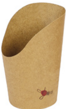
0310260 COPPA P/PATATINE AVANA PICCOLO capacità capacity 8 oz dimensioni size Ø60 h67/115 mm pz/conf pcs/pack 50 pz/cart pcs/box 1000