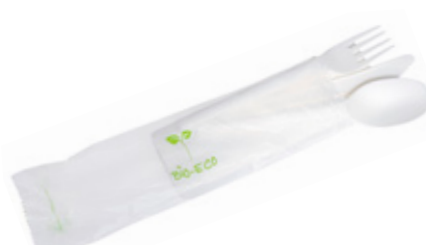
1VP219 TRIS C-PLA 5 gr cad. + TOVAGLIOLO (forchetta/coltello/cucchiaino/tovagliolo) (fork/knife/spoon/napkin) pz/cart pcs/box 250