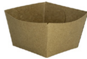
0310292 MONOPORZIONE AVANA 240cc dimensioni size 80x80h50 mm pz/conf pcs/pack 50 pz/cart pcs/box 1000