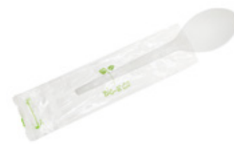
1VP211 CUCCHIAINO 13 cm IMB. SING. SPOON SINGLE WRAPPED pz/cart pcs/box 1000