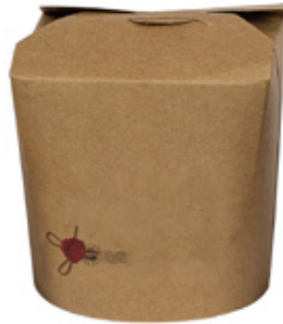
1BG082 TAKE AWAY BOX AVANA 750cc capacità capacity 750 cc pz/conf pcs/pack 50 pz/cart pcs/box 500