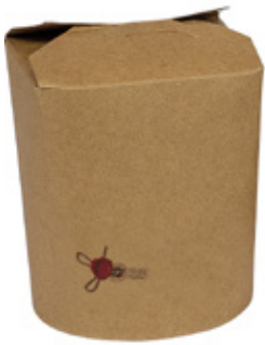
1BG080 TAKE AWAY BOX AVANA 500cc capacità capacity 500 cc pz/conf pcs/pack 50 pz/cart pcs/box 500