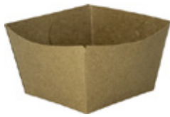
0310290 MONOPORZIONE AVANA 120cc dimensioni size 65x65h40 mm pz/conf pcs/pack 50 pz/cart pcs/box 1000