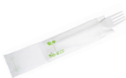
1VP215 FORCHETTA C-PLA 4 gr + TOVAGLIOLO FORK + NAPKIN pz/cart pcs/box 500