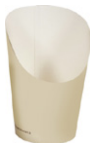
0310210 COPPA P/PATATINE PICCOLO capacità capacity 8 oz dimensioni size Ø60 h67/115 mm pz/conf pcs/pack 50 pz/cart pcs/box 1000