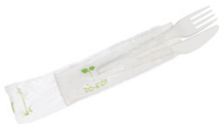
1VP216 BIS C-PLA 5 gr cad. + TOVAGLIOLO (forchetta/coltello/tovagliolo) (fork/knife/napkin) pz/cart pcs/box 250