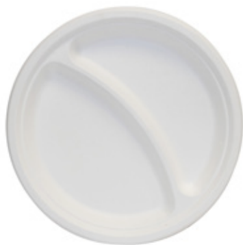
YDP038 PIATTO BIS BIO-ECO diametro diameter 22 cm temp. max PFAS-FREE 50° pz/conf pcs/pack 25 pz/cart pcs/box 500