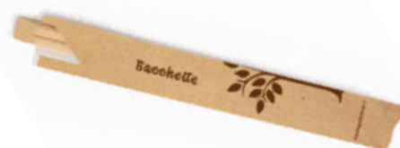
GWB2518A BACCHETTE BAMBOO INCARTATE dimensioni size 210x4,8 mm pz/conf pcs/pack 100 pz/cart pcs/box 2000