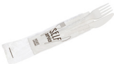
1VP416 BIS C-PLA 4 gr cad. + TOVAGLIOLO (forchetta/coltello/tovagliolo 1 velo) (fork/knife/napkin 1 layer) pz/cart pcs/box 500