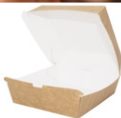
0310232 PORTA PANINO MEDIO PAP ONLY PAPER dimensioni size 120x120h70 mm pz/conf pcs/pack 100 pz/cart pcs/box 600