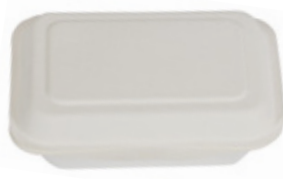
YDB004 CONTENITORE+COPERCHIO BIO-ECO dimensioni size 172x113 h37/52 mm capacità capacity 350 ml temp. max. PFAS-FREE 95° pz/conf pcs/pack 50 pz/cart pcs/box 1000