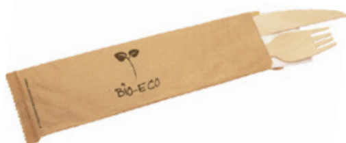
GW2453D BIS LEGNO + TOVAGLILOLO (forchette/coltello/tovagliolo 2 veli) (fork/knife/napkin 2 layers) pz/conf pcs/pack 50 pz/cart pcs/box 250