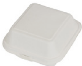
YDB003 CONTENITORE+COPERCHIO BIO-ECO dimensioni size 153x147 h48/78 mm capacità capacity 350 ml temp. max. PFAS-FREE 95° pz/conf pcs/pack 25 pz/cart pcs/box 500