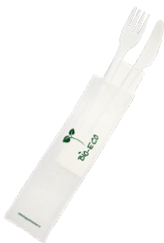
1VP376 BIS + TOV. 2 VELI (forch/colt) 75-80° gr 3,5 BIS+NAPKIN 2 LAYER (fork/knife) 75-80° gr 3,5 pz/cart pcs/box 500