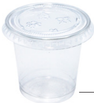
1VP250 COPERCHIO TRASP. PIANO PET dimensioni size Ø45 mm pz/conf pcs/pack 100 pz/cart pcs/box 2500