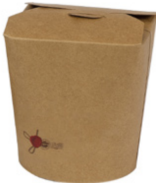
1BG084 TAKE AWAY BOX AVANA 1000cc capacità capacity 1000 cc pz/conf pcs/pack 50 pz/cart pcs/box 500