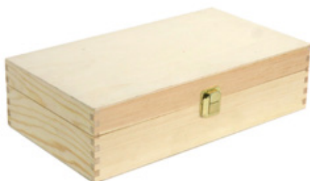
502352 CASSETTA CHIUSA 2 BOTTIGLIE PINO NATURALE dimensioni size 35x19 h9 cm pz/cart pcs/box 12