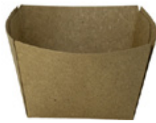
0310291 MONOPORZIONE AVANA 180cc dimensioni size 72x72h45 mm pz/conf pcs/pack 50 pz/cart pcs/box 1000