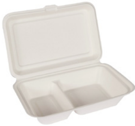
YDB040 CONTENITORE+COPERCHIO BIO-ECO BISCOMPARTI dimensioni size 240x160 h50 mm capacità capacity 650 ml temp. max. PFAS-FREE 95° pz/conf pcs/pack 50 pz/cart pcs/box 250