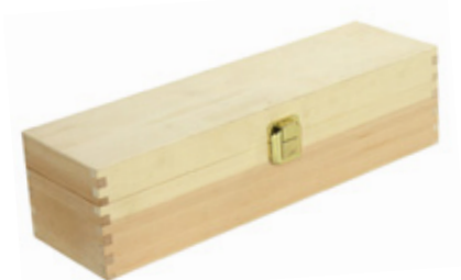
502350 CASSETTA CHIUSA 1 BOTTIGLIA PINO NATURALE dimensioni size 36x11 h10 cm pz/cart pcs/box 20