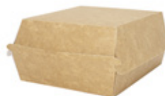
0310237 PORTA PANINO GRANDE PAP ONLY PAPER dimensioni size 130x130h110 mm pz/conf pcs/pack 50 pz/cart pcs/box 300