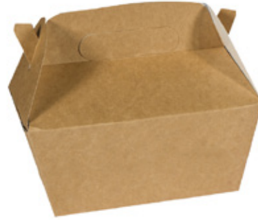
0310273 CARRYMEAL CON MANICO dimensioni size 228x122h97 mm pz/conf pcs/pack 50 pz/cart pcs/box 150