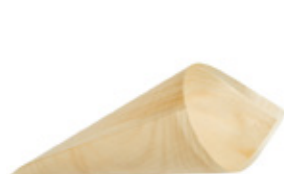
GW3029 CONO PALMA dimensioni size 125x85 mm pz/conf pcs/pack 50 pz/cart pcs/box 1000