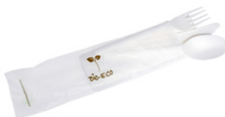
1VP319 TRIS C-PLA 4 gr cad. + TOVAGLIOLO (forchetta/coltello/cucchiaino/tovagliolo) (fork/knife/spoon/napkin) pz/conf pcs/pack 50 pz/cart pcs/box 250