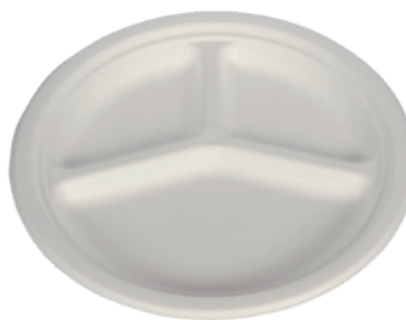
YDP007 PIATTO TRIS BIO-ECO diametro diameter 26 cm temp. max PFAS-FREE 50° pz/conf pcs/pack 25 pz/cart pcs/box 800