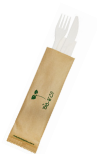
1VP326 BIS+TOV. 2 VELI (forch/colt) gr 3,5 cad. BUSTA CARTA BIS+NAPKIN 2 LAYER (fork/knife) 75-80° gr 3,5 PAPER BAG pz/cart pcs/box 500