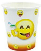
1BG019 BICCHIERI B20 ORANGE capacità capacity 200cc / 7oz tacca filling line 0,15 pz/conf pcs/pack 100 pz/cart pcs/box 2000