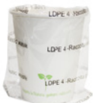
1BG800 BICCHIERI CARTA BH20 IMBUSTATI SINGOLARMENTE capacità capacity 200cc / 7oz pz/cart pcs/box 600