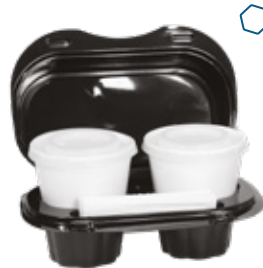
ICAN92 KAPPUCCIOBOX CONTENITORE+COPERCHIO PORTA 2 CAPPUCCINI pz/conf pcs/pack 50 pz/cart pcs/box 400