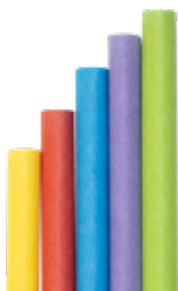
1CAN76 CANNUCCE DRITTE CARTA COLORI ASSORTITI dimensioni size h 200mm / Ø 7mm pz/conf pcs/pack 150 pz/cart pcs/box 4050