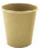
1BG009 BICCHIERI CAFFÈ BC05 NATURALE capacità capacità 80cc / 3oz pz/conf pcs/pack 100 pz/cart pcs/box 2000