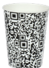
1BG021 BICCHIERI B25 CODICE Q.R. capacità capacity 250cc / 8oz tacca filling line 0,20 pz/conf pcs/pack 100 pz/cart pcs/box 2000