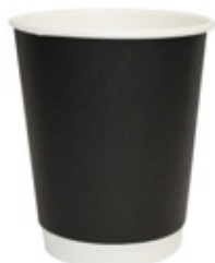
1BG220 DOUBLE WALL BW25 colori colors NERO / AVANA capacità capacity 250cc / 8oz pz/conf pcs/pack 25 pz/cart pcs/box 500