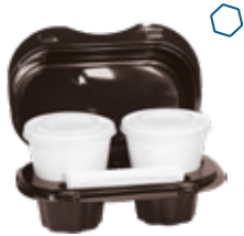
ICAN90 KAFFEBOX CONTENITORE+COPERCHIO PORTA 2 CAFFÈ pz/conf pcs/pack 55 pz/cart pcs/box 550