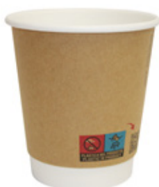
1BG222 DOUBLE WALL BW35 colori colors NERO / AVANA capacità capacity 350cc / 10oz pz/conf pcs/pack 25 pz/cart pcs/box 500