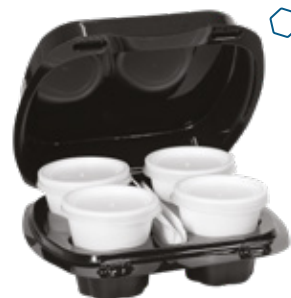
ICAN93 KAPPUCCIOBOX CONTENITORE+COPERCHIO PORTA 4 CAPPUCCINI pz/conf pcs/pack 45 pz/cart pcs/box 180