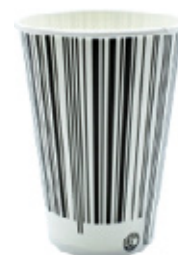
1BG022 BICCHIERI B30 CODICE BARCODE capacità capacity 300cc tacca filling line 0,25 pz/conf pcs/pack 100 pz/cart pcs/box 2000