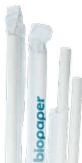
1CAN72 CANNUCCE DRITTE CARTA INCARTATE dimensioni size h 200mm / Ø 6mm pz/conf pcs/pack 150 pz/cart pcs/box 4500