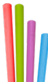
1CAN59 CANNUCCE DRITTE BIO-ECO COLORI ASSORTITI dimensioni size h 210mm / Ø 6mm pz/conf pcs/pack 250 pz/cart pcs/box 6000