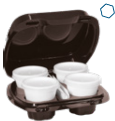
ICAN91 KAFFEBOX CONTENITORE+COPERCHIO PORTA 4 CAFFÈ pz/conf pcs/pack 60 pz/cart pcs/box 360