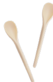
1BG168 CUCCHIAINI PLA YOGURT/GRANITA dimensioni size h 17,5cm pz/conf pcs/pack 200 pz/cart pcs/box 2000