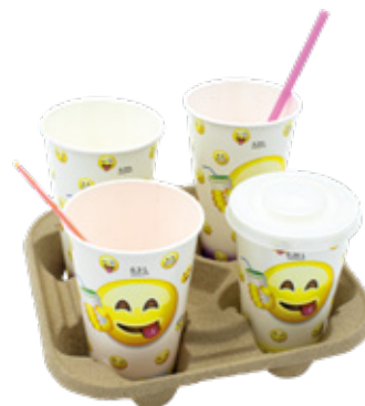
1BG642 VASSOI PORTA 4 BICCHIERI CARTA pz/conf pcs/pack 50 pz/cart pcs/box 300