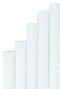
1CAN77 CANNUCCE DRITTE CARTA BIANCA dimensioni size h 200mm / Ø 8mm pz/conf pcs/pack 150 pz/cart pcs/box 3150