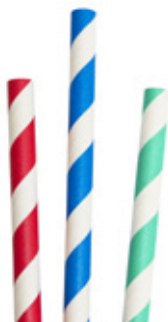
1CAN79 CANNUCCE DRITTE CARTA SPIRALE COLORI colori disponibili available colors rosso/blu/verde dimensioni size h 200mm / Ø 8mm pz/conf pcs/pack 150 pz/cart pcs/box 3150