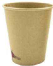
1BG630 BICCHIERI HOT BC20 capacità capacità 200cc / 7oz pz/conf pcs/pack 50 pz/cart pcs/box 2000