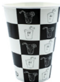
1BG029 BICCHIERI B42 SCACCHIERA capacità capacity 420cc / 12oz tacca filling line 0,33 pz/conf pcs/pack 100 pz/cart pcs/box 2000