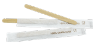
GW2913P PALETTE CAFFÈ LEGNO INCARTATE SINGOLARMENTE dimensioni size h 9cm pz/conf pcs/pack 1000 pz/cart pcs/box 10000