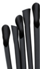
1CAN51 CANNUCCE PLA CON CUCCHIAIO BIO-ECO dimensioni size h 210mm / Ø 6mm pz/conf pcs/pack 250 pz/cart pcs/box 6000