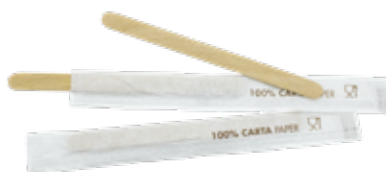
GW2912P PALETTE CAFFÈ LEGNO INCARTATE SINGOLARMENTE dimensioni size h 11cm pz/conf pcs/pack 1000 pz/cart pcs/box 10000