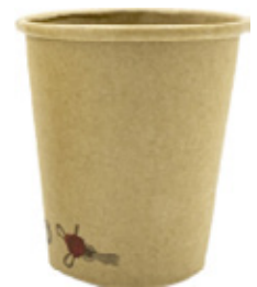
1BG632 BICCHIERI HOT DRINK BC35 capacità capacità 350cc / 10oz pz/conf pcs/pack 50 pz/cart pcs/box 1000