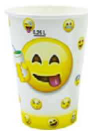
1BG022 BICCHIERI B30 YELLOW capacità capacity 300cc tacca filling line 0,25 pz/conf pcs/pack 100 pz/cart pcs/box 2000