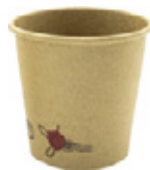
1BG017 BICCHIERI CAFFÈ BC10 capacità capacità 120cc / 4oz pz/conf pcs/pack 50 pz/cart pcs/box 2000