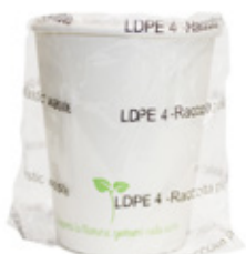
1BG802 BICCHIERI CARTA BH25 IMBUSTATI SINGOLARMENTE capacità capacity 250cc / 8oz pz/cart pcs/box 600