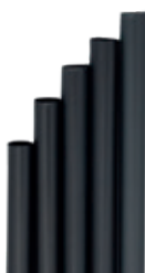
1CAN60 CANNUCCE DRITTE PLA NERE BIO-ECO dimensioni size h 210mm / Ø 6mm pz/conf pcs/pack 150 pz/cart pcs/box 3450