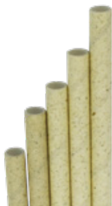
1CAN70 CANNUCCE DRITTE CARTA AVANA KRAFT dimensioni size h 200mm / Ø 6mm pz/conf pcs/pack 250 pz/cart pcs/box 7000