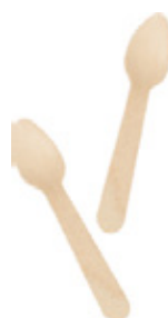
GW2407 CUCCHIAINI IN LEGNO WOODEN SPOONS dimensioni size h 11cm pz/conf pcs/pack 100 pz/cart pcs/box 5000