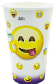
1BG029 BICCHIERI B42 VIOLETTA capacità capacity 420cc / 12oz tacca filling line 0,33 pz/conf pcs/pack 100 pz/cart pcs/box 2000