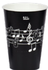
1BG023 BICCHIERI B37 PENTAGRAMMA NERO capacità capacity 370cc tacca filling line 0,30 pz/conf pcs/pack 100 pz/cart pcs/box 2000