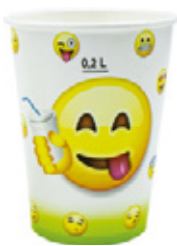
1BG021 BICCHIERI B25 GREEN capacità capacity 250cc / 8oz tacca filling line 0,20 pz/conf pcs/pack 100 pz/cart pcs/box 2000