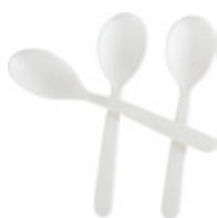
1VP226 CUCCHIAINI PLA BIO-ECO dimensioni size h 10,5cm pz/conf pcs/pack 100 pz/cart pcs/box 2000