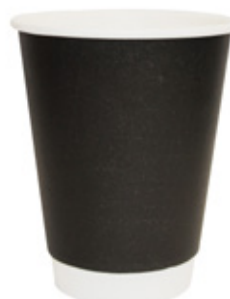
1BG224 DOUBLE WALL BW42 colori colors NERO / AVANA capacità capacity 420cc / 12oz pz/conf pcs/pack 25 pz/cart pcs/box 500