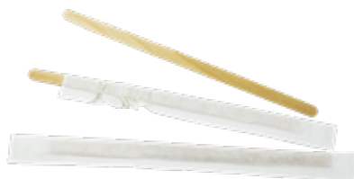
GW2908P PALETTE CAFFÈ LEGNO INCARTATE SINGOLARMENTE dimensioni size h 14cm pz/conf pcs/pack 1000 pz/cart pcs/box 10000