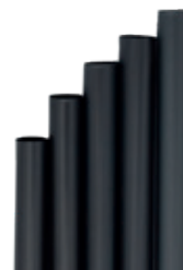
1CAN62 CANNUCCE DRITTE PLA NERE COCKTAIL BIO-ECO dimensioni size h 150mm / Ø 8mm pz/conf pcs/pack 250 pz/cart pcs/box 3000