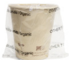
1BG810 BICCHIERI CARTA COMPOSTABILE BH20 IMBUSTATI SINGOLARMENTE capacità capacity 200cc / 7oz pz/cart pcs/box 600