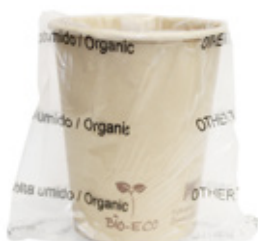
1BG812 BICCHIERI CARTA COMPOSTABILE BH25 IMBUSTATI SINGOLARMENTE capacità capacity 250cc / 8oz pz/cart pcs/box 600