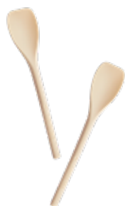
1BG167 CUCCHIAINI PLA YOGURT/GRANITA dimensioni size h 13,8cm pz/conf pcs/pack 300 pz/cart pcs/box 3000