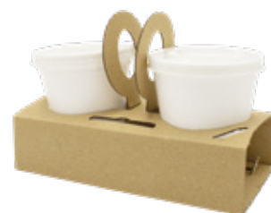
1SP101 CAPPUCCIO SPEED pz/conf pcs/pack 100 pz/cart pcs/box 600