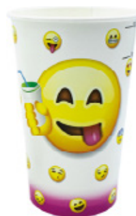
1BG030 BICCHIERI B55 FUCHSIA capacità capacity 550cc / 16oz tacca filling line 0,40-0,50 pz/conf pcs/pack 50 pz/cart pcs/box 1000