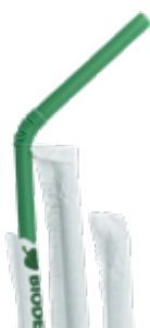
1CAN64 CANNUCCE PIEG. PLA BIO-ECO INCARTATE dimensioni size h 240mm / Ø 5mm pz/conf pcs/pack 400 pz/cart pcs/box 6400