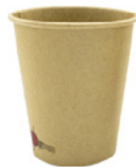
1BG631 BICCHIERI HOT BC25 capacità capacità 250cc / 8oz pz/conf pcs/pack 50 pz/cart pcs/box 1000