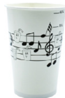
1BG030 BICCHIERI B55 PENTAGRAMMA BIANCO capacità capacity 550cc / 16oz tacca filling line 0,40-0,50 pz/conf pcs/pack 50 pz/cart pcs/box 1000