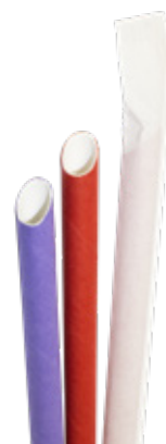
1CAN80 CANNUCCE CARTA BUBBLE TEA INCARTATE colori disponibili available colors assortiti dimensioni size h 200mm / Ø 12mm pz/conf pcs/pack 100 pz/cart pcs/box 1500