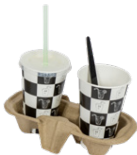
1BG640 VASSOI PORTA 2 BICCHIERI CARTA pz/conf pcs/pack 50 pz/cart pcs/box 600