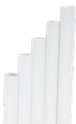
1CAN41 CANNUCCE DRITTE PLA BIANCHE BIO-ECO dimensioni size h 210mm / Ø 6mm pz/conf pcs/pack 150 pz/cart pcs/box 3450