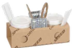
1SP100 COFFEE SPEED pz/conf pcs/pack 100 pz/cart pcs/box 600